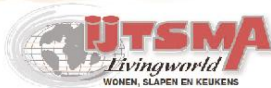
Ons team graag voor u klaar!